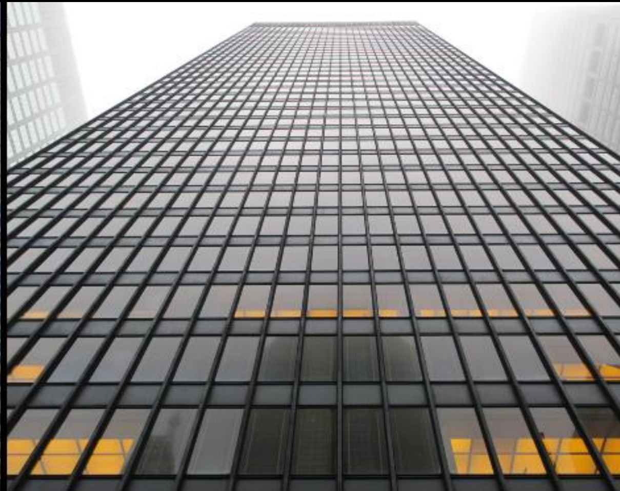
Ludwig Mies van der Rohe : Seagram Building, 1954-58, New York

11, rue Edmond Rostand 13006 Marseille Tél.: 04 13 94 61 81 Mail: utl-marseille@univ-amu.fr https://utl.univ-amu.fr/activites-a-marseille