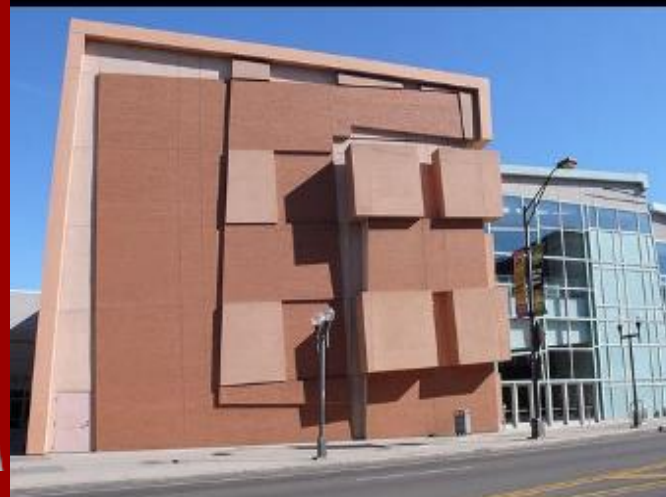
Peter Eisenman : Gerald R. Ford Library (1973)