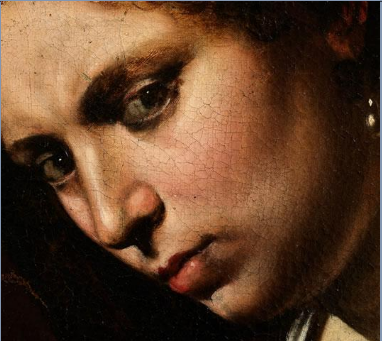
Michelangelo Merisi, dit il Caravaggio ou le Caravage

Le nom de Michelangelo Merisi, dit Le Caravage, est attaché à une légende noire, dont le peintre est sans doute le premier responsable. On tâchera de suivre ses pérégrinations à travers les évolutions de son œuvre, de Rome à Syracuse en passant par Malte. Comme l'autre Michel-Ange, on se demandera aussi comment une peinture essentiellement religieuse a pu approcher si près de l'irrégion. Au sein du courant baroque qu'il contribue à former, on s'interrogera sur la façon dont son réalisme s'accorde ou au contraire outrepassé les attentes de ses contemporains comme celles de ses successeurs de style classique. Aussi cette conférence sur l'œuvre peinte du Caravage vise-t-elle à la fois à en démontrer la cohérence interne et son inscription complexe, voire conflictuelle, dans le contexte de son époque.