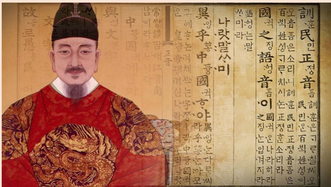
Roi Sejong (18-09-1418/18-05-1450)

Grâce à l'audace d'un roi, un al phabet original verra le jour au XVe siècle, ce qui va permettre entre autres d'exacerber le sentiment d'identité face aux puissances régionales telles que le Japon et la Chine.