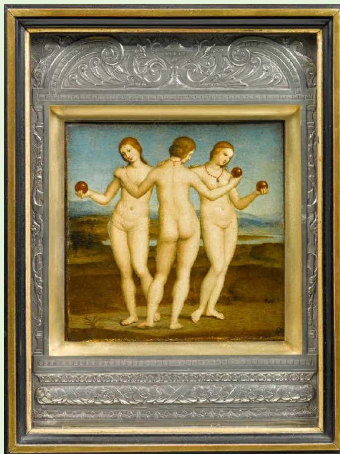
Les trois grâces, Raphael (15/03/1508)

Les Trois Grâces sont un groupe sculptural de la Grèce antique admiré à la Renaissance par de nombreux peintres, dont Raphaël. Le peintre en donnera sa propre interprétation, sous la dictée des codes esthétiques de l'Antiquité, et définira ainsi les canons de la beauté féminine de la Renaissance. Grâce, sensibilité, féminité, l'œuvre de Raphaël aujourd'hui conservée au musée de Chantilly, va traverser les temps, faisant autorité dans l'histoire de la représentation de la femme dans l'art occidental. Les citations se déclinent ainsi dans le temps jusqu'aux artistes contemporains, comme le canadien Kent Monkman qui détourne l'œuvre de Raphaël pour proposer une autre définition de la beauté.